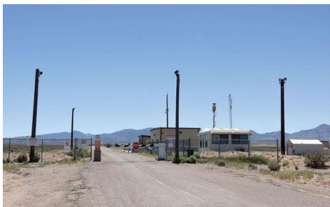
Vaktkuren vid södra ingången till Area 51.